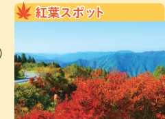
高野龍神スカイライン

和歌山県田辺市 龍神村龍神 37 営業時間：7:00～21:00 (閉館) 入湯料：大人 700円ほか 定休日：なし TEL 0739-79-0726