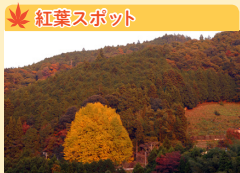
宝泉寺 (福定の大銀杏)

和歌山県田辺市 本宮町湯の峰 110 営業時間：6:00～21:30 (30分交代制) 入湯料：大人 770円 定休日：なし TEL 0735-42-0074