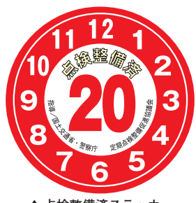
▲点検整備済ステッカー